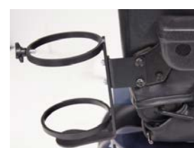
Supporto per bombola ossigeno ELTP020909 107 mm ELTP020910 119 mm