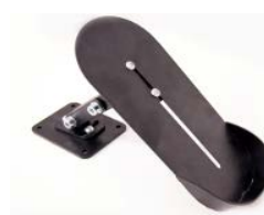
Supporto per piede regolabile in angolazione ELTP020904