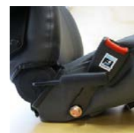
Cintura di sicurezza con fibbia ELTP020900