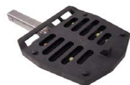
Piastra di montaggio universale posteriore ELTP020100