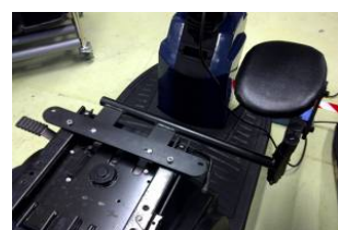
Supporto per amputati ELTP010753 (dx) ELTP010754 (sx)