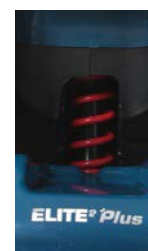
Sospensione idraulica per utenti da 125 a 175 kg ELTP010600