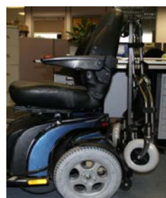
Supporto per deambulatore ELTP020907