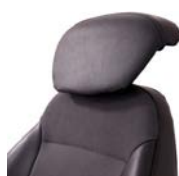
Prolunga schienale comfort ELTP010726