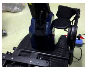
Pedana elevabile ELTP010750 (dx) ELTP010751 (sx)