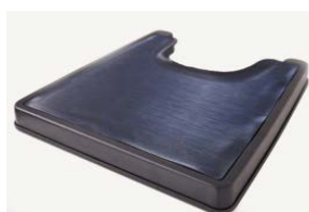
Appoggiapiedi rialzato ELTP020903