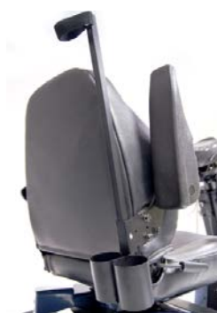
Porta stampella montato sul sedile ELTP020905 Porta stampella montato sul telaio posteriore ELTP020906