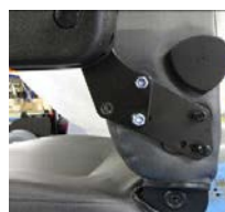
Braccioli regolabili in altezza ELTP010725