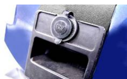
Uscita USB 5V e uscita per caricabatterie cellulare a 12V ELTP010201