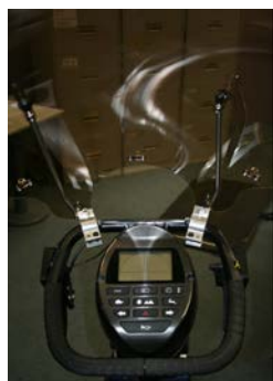
Parabrezza deflettore (montato sul manubrio) ELTP020912