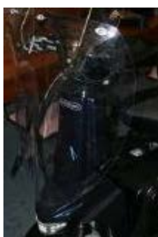
Deflettore (protezione laterale aggiuntiva per il manubrio) ELTP020914