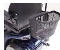
Cestino sganciabile ELTP020102