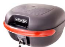
Bauletto sganciabile montato su piastra di montaggio universale ELTP020101