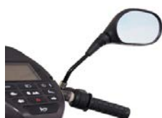
Specchietto retrovisore ELTP020901 (sx) ELTP020902 (dx)